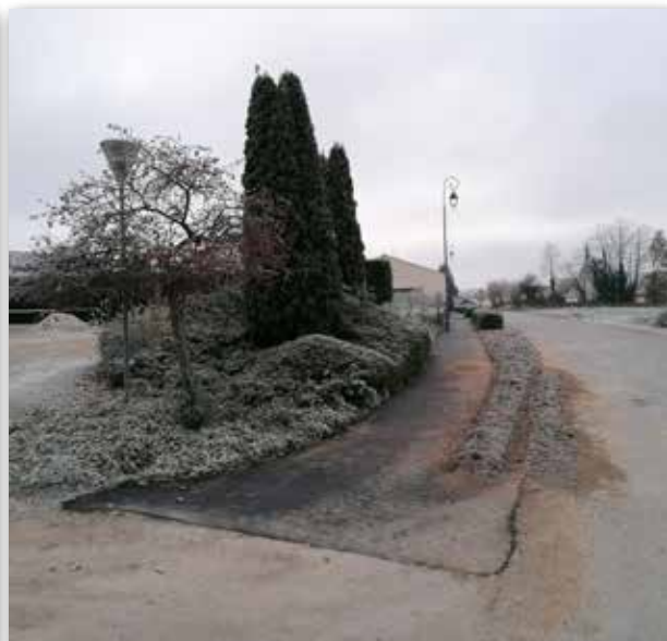
La création d'un cheminement depuis l'école Notre Dame de Pontmain vers la salle polyvalente en enrobé.