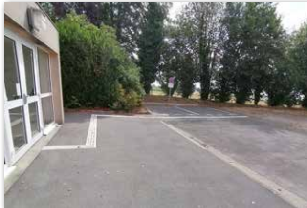
La réalisation de deux places de stationnement adaptées PMR avec le cheminement à la porte d'entrée