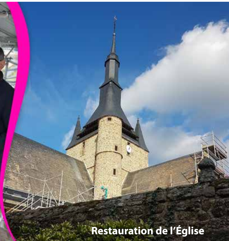
Restauration de l'Église