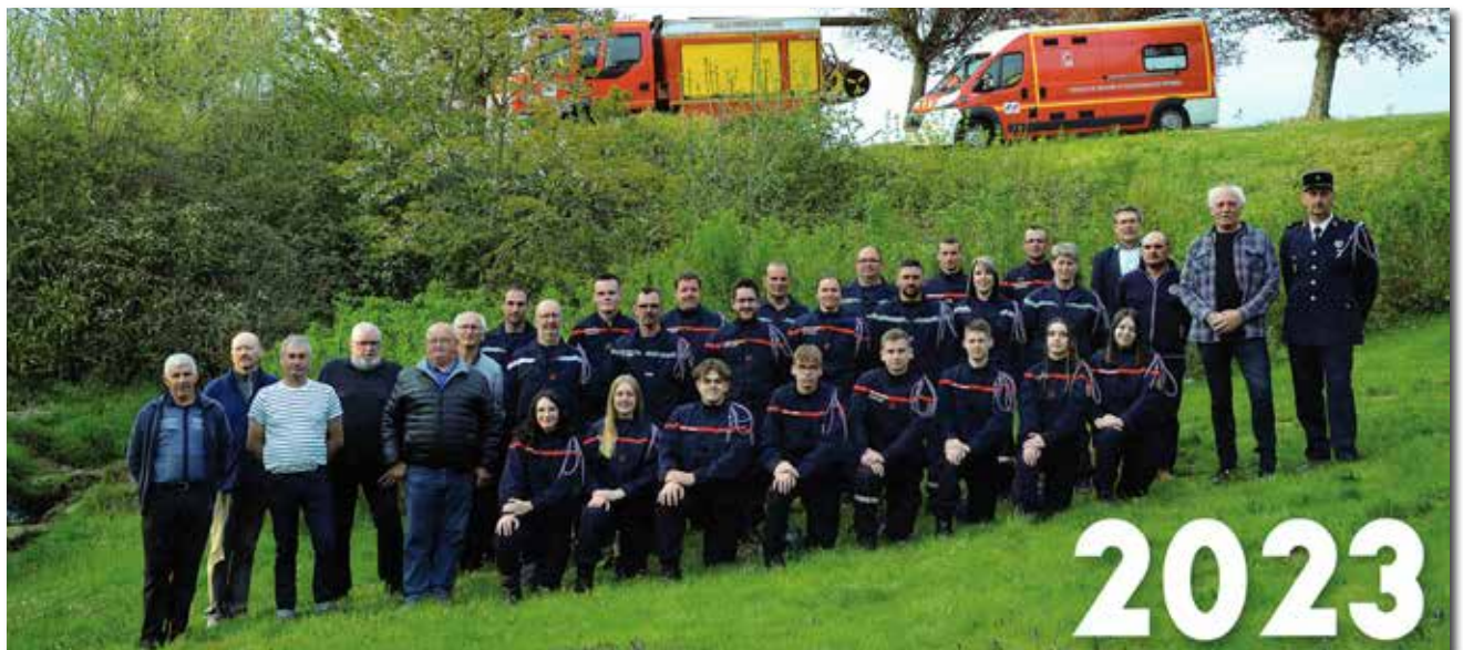
Sapeurs-Pompiers - Commémoration de la Sainte Barbe 2022