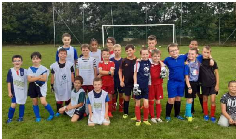
École de Football