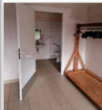
La mise en place de tablettes permettant l'accès d'un fauteuil roulant au bar et au vestiaire. La modification de l'accès au sanitaire handicapé avec la porte donnant directement sur le hall d'entrée.