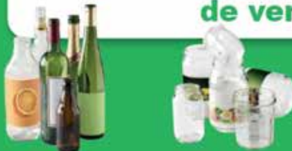
POTS, BOCAUX, BOUTEILLES EN VERRE ET BOUTEILLES DE PARFUM

Les opercules, capsules et couvercles sont à mettre dans le conteneur jaune .